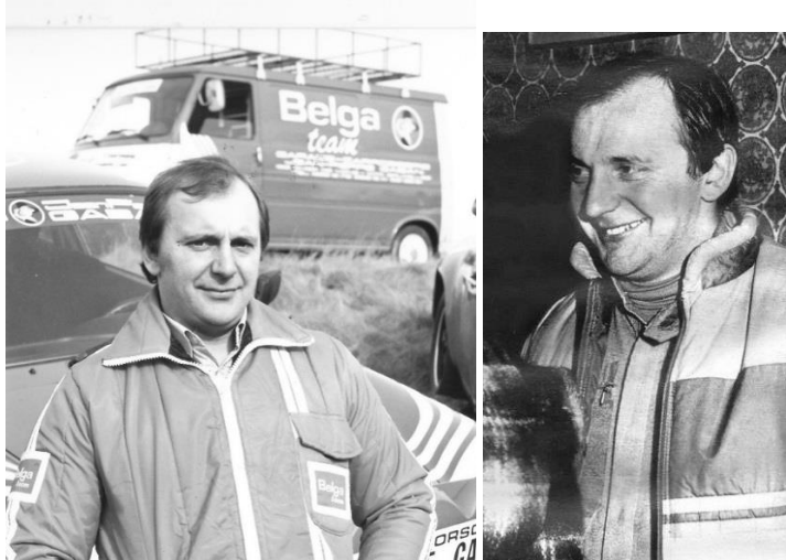
Vainqueur Condroz 80