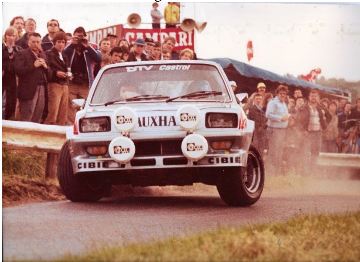
Dumont- Rorife Ypres 1980.