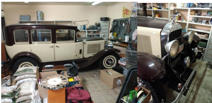
Buick Sedan 1929

Diverses pièces + moteur et boîte de vitesses disponibles : prix sur demande Nanine HANON 0479 20 71 15 hanonnanine@gmail.com