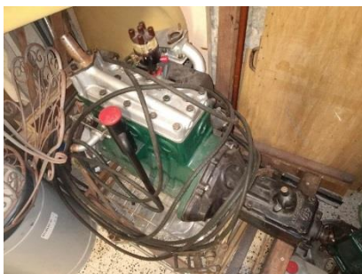
MERCEDES 170 V de 1937