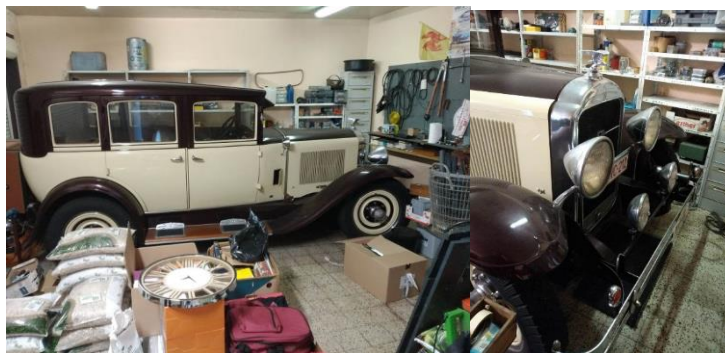
Buick Sedan 1929