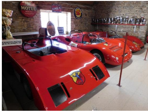
Savigny les Beaune ABARTH