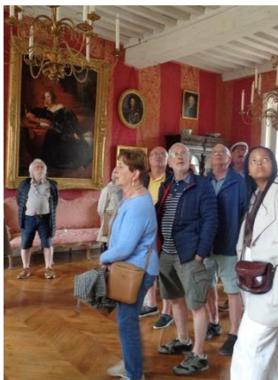
Intérieur de BUSSY RABUTIN