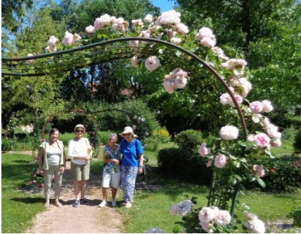
Roseraie à La Celle