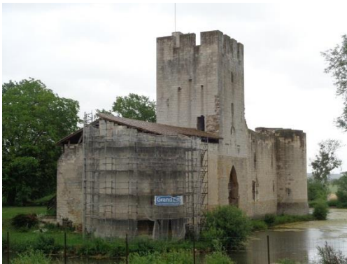
Château de GOMBERVAUX