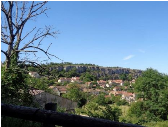
Falaise de Saint Romain