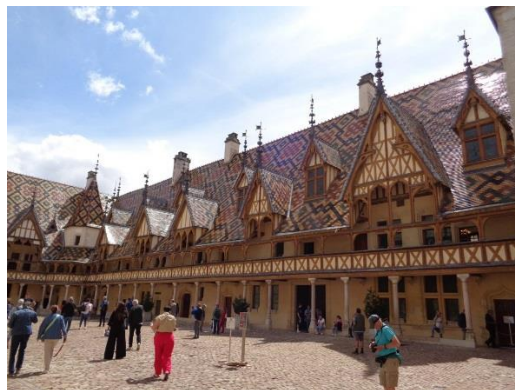
Beaune hôtel Dieu