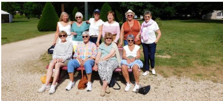
Les Dames à SAVIGNY les BEAUNE